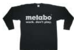
Tričko dlhý rukáv