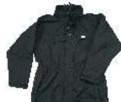
Bunda HH Haag Parka