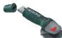
USB kľúč (4 GB)