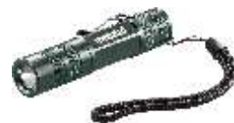
Ručná LED baterka Obj. č.: 657002000