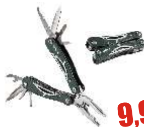
Multi-Tool - univerzálne kliešte Obj. č.: 657001000